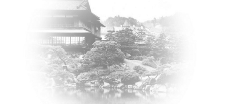
제2차 세계대전 이전의 소라쿠엔 본관(쇼후칸)

정문을 들어서면 도심에서는 찾아볼 수 없는 이풍경이 펼쳐진다. 메이지시대, 이곳에 터를 잡은 주인과 정원사가 만든 정원에서 상상의 나라를 펼쳐본다.