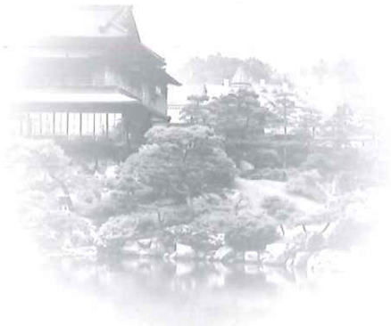
Il Sorakuen prima della Seconda Guerra Mondiale, Edificio Principale (Shofukan)

Una volta superato l'ingresso principale, ci si trova davanti ad un paesaggio che mai penseremmo di vedere nel centro di una città. Ci sembra di essere così ricatapultati nell'Era Meiji (1868-1912), quando il padrone e il giardiniere realizzarono questo giardino.