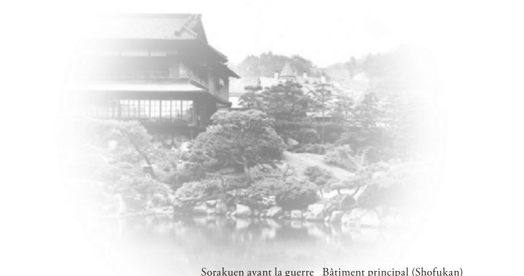
Sorakuen avant la guerre Bâtiment principal (Shofukan)

Après avoir franchi la porte, il est difficile d'imaginer être au coeur de la ville. On songe au propriétaire qui a construit sa demeure ici à l'époque Meiji, et au jardin conçu par le maître jardinier.