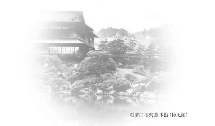
戰前的相樂園 本館(樟風館)

穿過正門，映入眼簾的是有別於都會中心的另一番風景 遙想明治時代在這裡建築家園的主人如何與造園師傅精心營造這園美景