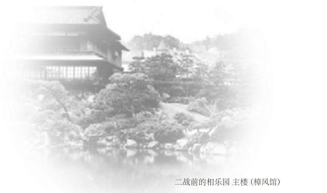
二战前的相乐园 主楼（樟风馆）

一进入正门眼前便展现出完全不同于都市中心的别样景色。追思神往明治时代在这里定居的主人和造园师所创建的庭院。